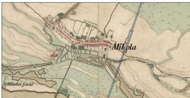
Mikola a második katonai felmérés térképén

Mikola 2025: Mikola, Mikolába, mikolaji , 2000: Mikola , 1992: Mikola , 1944: Mikola , 1942: Mikola , 1941: Mikola , 1935–1936: Mikola | Kenyeretlem Mikola Éhē hal ott a puja. | Zsidóú megyem Mikolába, Löttyög a té a hasába [A mikolaiakat csúfoló vers] | Egri, Mikola, Homok, Ott a jányok mind lomok. [Gúnyvers] | Ki-nálgatóúznak, mint a mi-kolajiak. [Szólás], 1933: Mikola , 1931: Mikola , [1925 k.]: Mikola , 1918: Mikola , 1913: Mikola , 1911: Mikola , 1897: Mikola , 1892: Mikola , 1889: Mikola , 1884: Mikola , 1873: Mikola , 1870: Mikola , 1867: Mikola , 1864: Mikola, Mikola, Mikolai | Mikola derék Magyar falu a Tur háton fel emelkedet földön. | Népesítetett a magyarok által. | Szántó földjét három fordullóra van fel osztva a földje agyagos és homokos lévén buzát, tengerit, rozstot, Zabot dinnyet terem, az árvíz nem járja. 1863–1864: Mikola , 1860: Mikola , 1851: Mikola , 1840: Mikola , 1839: Mikola , 1832: Mikola , 1828: Mikola , 1808: Mikola , 1806: Mikola , 1802: Mikola , 1799: Mikola , 1786: Mikola , 1784: Mikola , 1779: Mikola , 1773: Mikola , 1756: Mikola , [1740 k.]: Mikola , 1725: Mikola , 1637: Mikola , 1620: Mikola , 1605: Mikola , 1598: Mykola , 1578: Mykola , 1563/1864: Mykola , 1549: Mykola , 1525: Mykola , 1493: Mykola , 1486: Mijkola , 1475: Nykola , 1468: Mykola , 1404: Mikula , 1389: Micula , 1383: Mykola , 1380: Mikola , 1378: