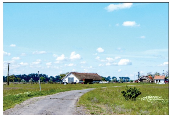
Új Élet juhtelep

Új Élet juhtelep 2022: Új Élet juhtelep . — Épület, mely az egykori Új Élet téesz juhtelege volt. Akkoriban az Új Élet téesz területeinek határát adta, ma magánszemély tulajdonában van, gazdálkodás folyik rajta. — ÉGy. — T25-H3.