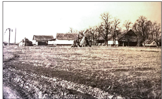
A Kapros-tanya 1980-ban

Kapros-tanya 2013: Kapros-tanya , 1970: Kapros-tanya , 1927: Kapros tn. [tanya] , 1918: Kapros tn. [tanya] , 1907: Kapros tanya , 1902: Kapros tanya , 1900: Kapros tn. [tanya] , 1883: Kapros tn. [tanya] , 1858: Kaprosi Tanya . — Tanya, mely a Hajdúnánásra vezető úttól délre a Kaproson található. Kaprosi-tanya formában is említik. — ÉGy., HKFT., Hnt., MKFT., PJFN. 19, T16.T.526, T16.T.562, T22.B.IX.a.2076. — T11-E3.