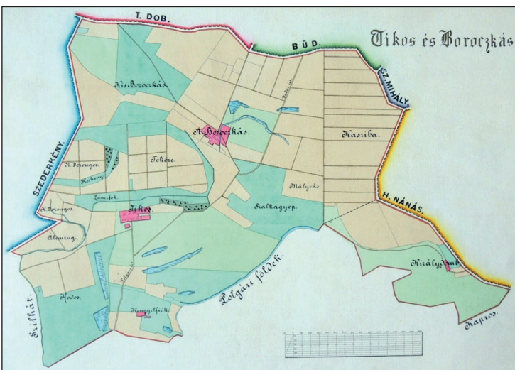
Újtikos területe egy 1883-ból való térképen (T10.FM.93)

T16.T.409, T16.T.526, T16.T.562, T16.T.584, T21.TK.2164, T22.B.IX.a.521.