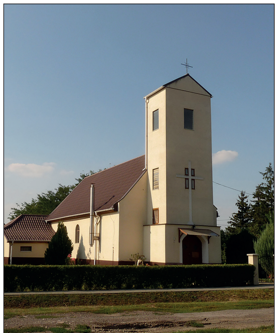
Katolikus templom

Katolikus templom 2023: Katolikus templom . — A Széchenyi téren álló templom. — ÉGy. — T52-B4.