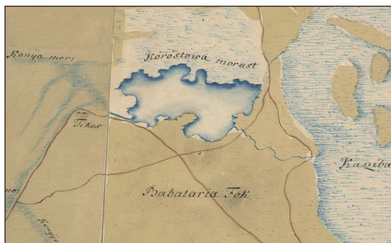
A Körös tava az első katonai felmérés térképén

MÓDY 2006: 360, MoFnT. 2/9, NÉMETH 2023: 235, NYÍRCSÁK 1993: 2, PESTY 1864/38: 268b, PJFN. 13, SUGÁR 1974a: 441, TERGE 1968: 80, T1.S.11.830/16, T1.S.79.929/8, T10.FM.4, T10.FM.37, T10.FM.46, T10.FM.48, T10.FM.94, T10.FM.120, T16.T.544, T21.TK.2164. — T3-G3.